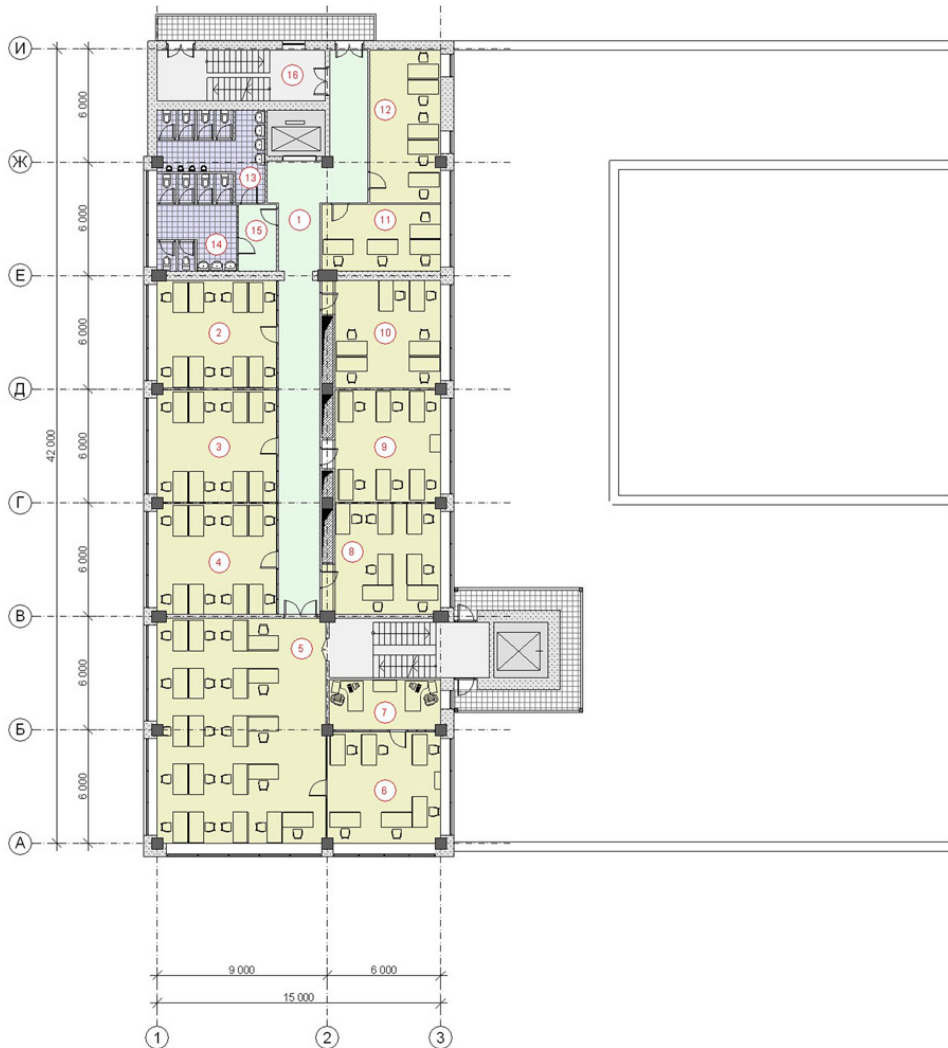
ЭКСПЛИКАЦИЯ ПОМЕЩЕНИЙ ДВЕНАДЦАТОГО ЭТАЖА