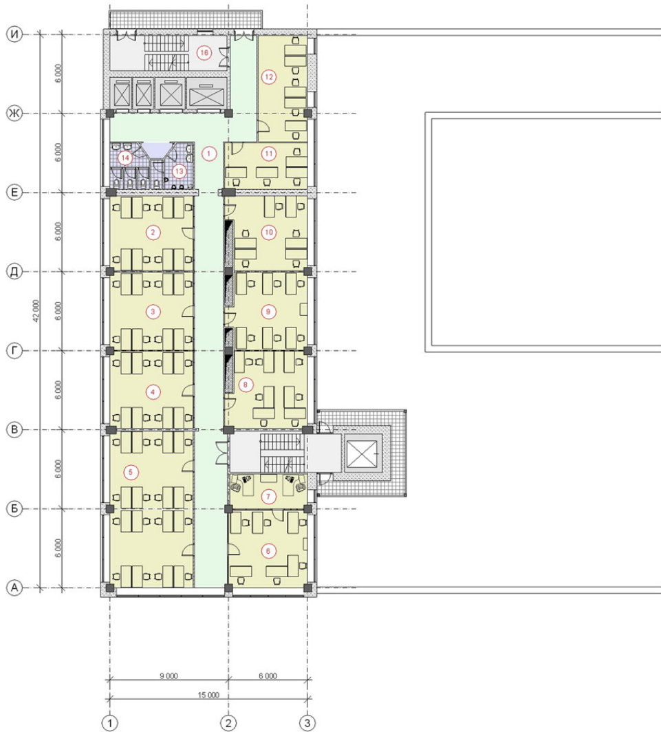
ЭКСПЛИКАЦИЯ ПОМЕЩЕНИЙ ПЯТОГО ЭТАЖА